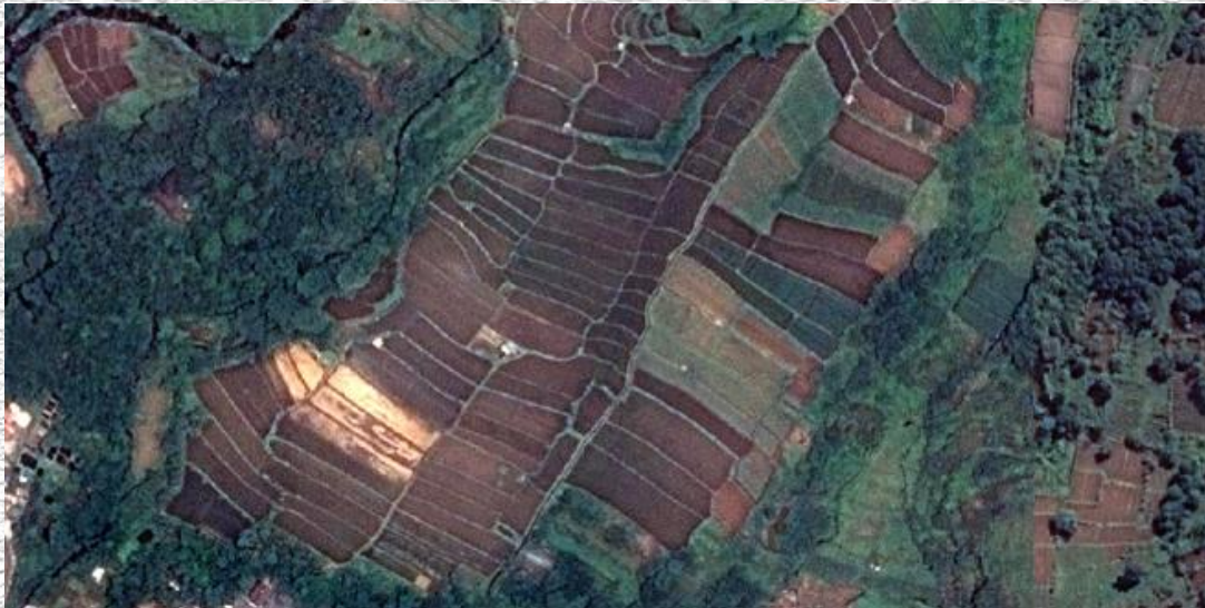
Source: Satellite Imagery - Pleiades 50cm resolution

Delineasi Petak Sawah (Artificial Intelligence)